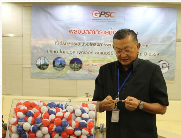
ผู้บริหารร่วมกันจับฉลาก